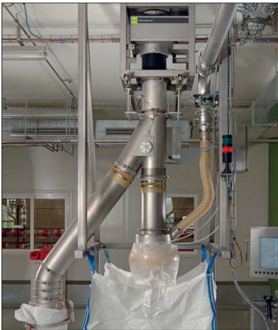
Máy dò kim loại tuân theo chuẩn IFS trực tiếp trước khi rót sản phẩm gia vị vào bao.