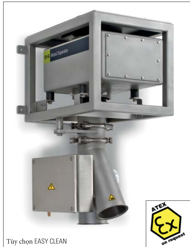
Tùy chọn EASY CLEAN