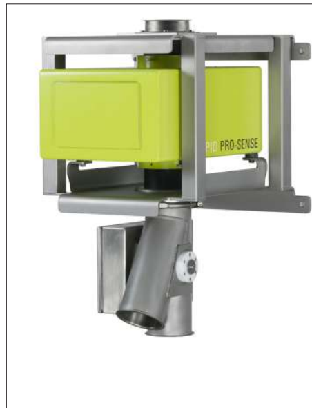
Thiết bị reject tròn để kiểm tra nguyên liệu dạng bột