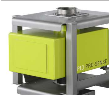
Thiết bị dò với công nghệ HRF tiên tiến

Thiết bị dò với công nghệ HRF tiên tiến (High Resolution Frequency) đã được phát triển đặc biệt để đảm bảo tối ưu hóa độ nhạy cho tất cả các kim loại. Các tín hiệu dò được truyền đi với một tần số đặc biệt và đã được đánh giá. Ngoài ra, kim loại sắt và kim loại màu, thậm chí các mẫu nhỏ nhất của thép không gỉ có thể được phát hiện và tách thậm chí hiệu quả hơn.