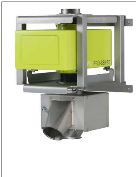
Thiết bị reject tiêu chuẩn "Quick-Flap"