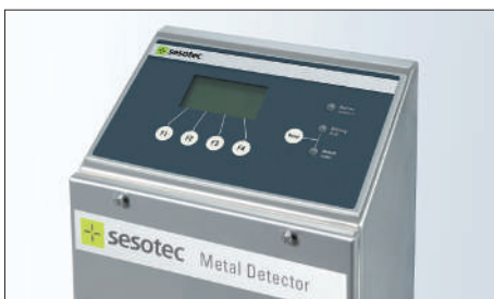
Bộ điều khiển điện tử GENIUS+