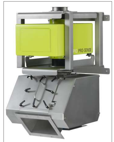
Thiết bị reject với phễu xoay cho nguyên liệu đặc biệt (Hình ảnh bao gồm các tùy chọn)