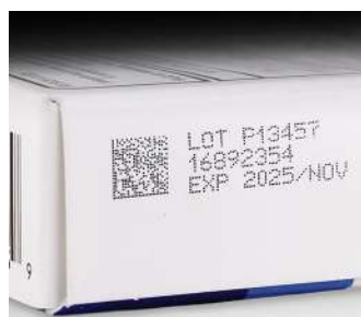
Dược phẩm – bia giấy