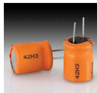
Linh kiện điện tử – nhựa