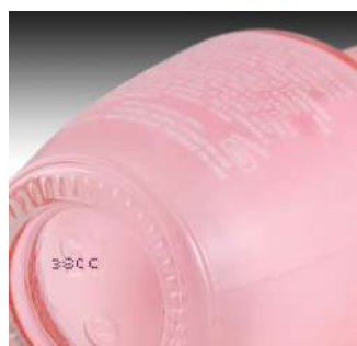
Đúc ép – nhựa