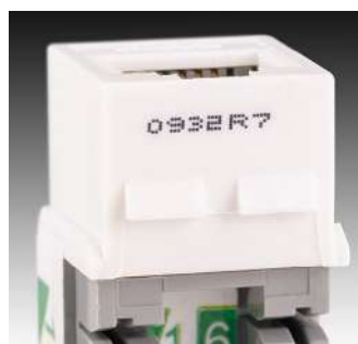
Đồ uống – nhựa