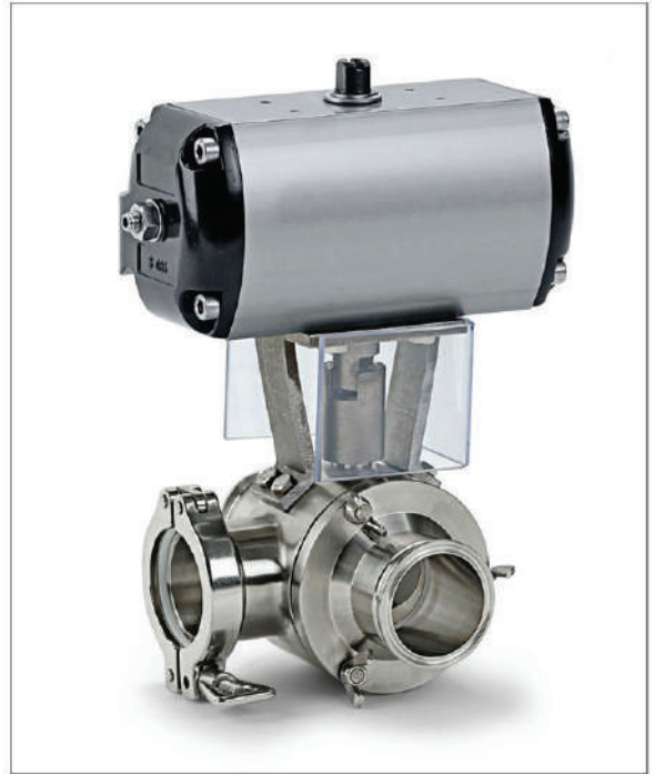
Hệ thống tách: Van bi