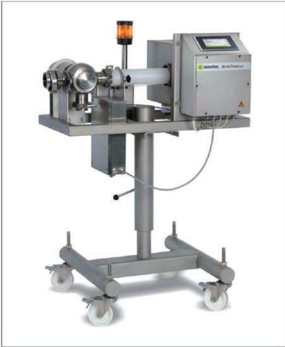
LIQUISCAN PL với chân đế có thể điều chỉnh độ cao

Nếu được yêu cầu, hệ thống cũng có sẵn trên một giá đỡ di động, có thể điều chỉnh độ cao.